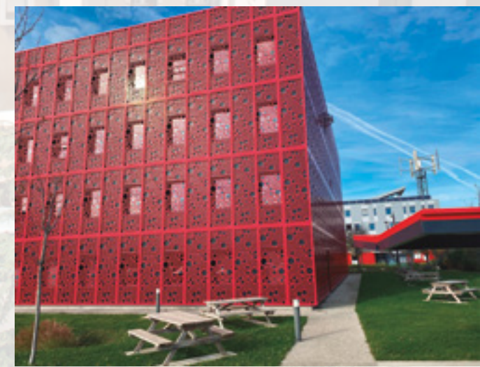
Oficina principal Kiwa Francia

Como no podía ser de otra manera las cosas del comer se cuidan mucho en la zona (¡no olvidemos que estamos en Francia!). La oferta gastronómica es rica y variada pero, puestos a elegir, un famoso pastel acapara la atención de los paladares más exigentes: se trata del famoso "suizo", a base de pasta brisa con cáscara de naranja confitada y aroma de azahar, y su peculiar forma de persona. Otra cosa que destaca y mucho en Valence y alrededores es la deliciosa oferta de quesos con personalidad propia. Podemos comenzar nuestra degustación con un poco de un saint-marcellin. Seguir con una porción de bleu de Vercors-Sassenage y continuar con la fuerte personalidad del picodon del Drôme. ¡Bon appetit!